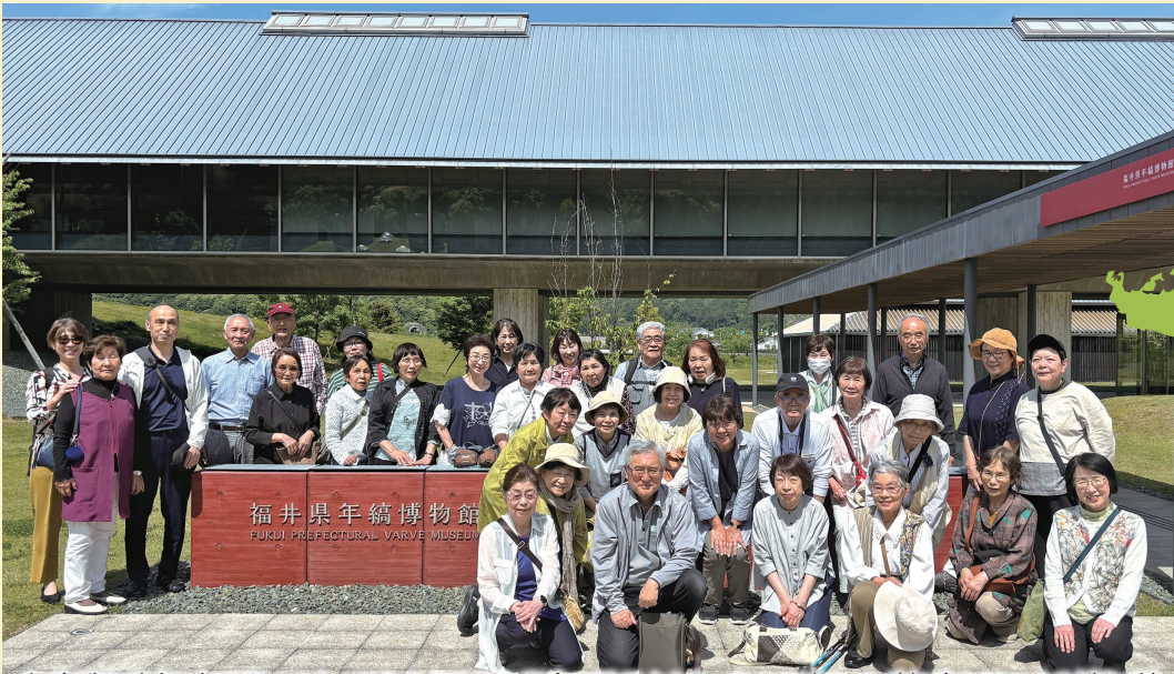
年縞博物館〈三方五湖のひとつである水月湖の湖底で発見された、約7万年に及ぶ年縞を展示する博物館〉

●年縞(ねんこう)とは「長い年月の間に湖沼などに堆積した層が描く特徴的な縞模様の湖底堆積物」のことで、1年に1層形成されます。縞模様は季節によって違うものが堆積することで、明るい層と暗い層が交互に堆積することでできるものです。